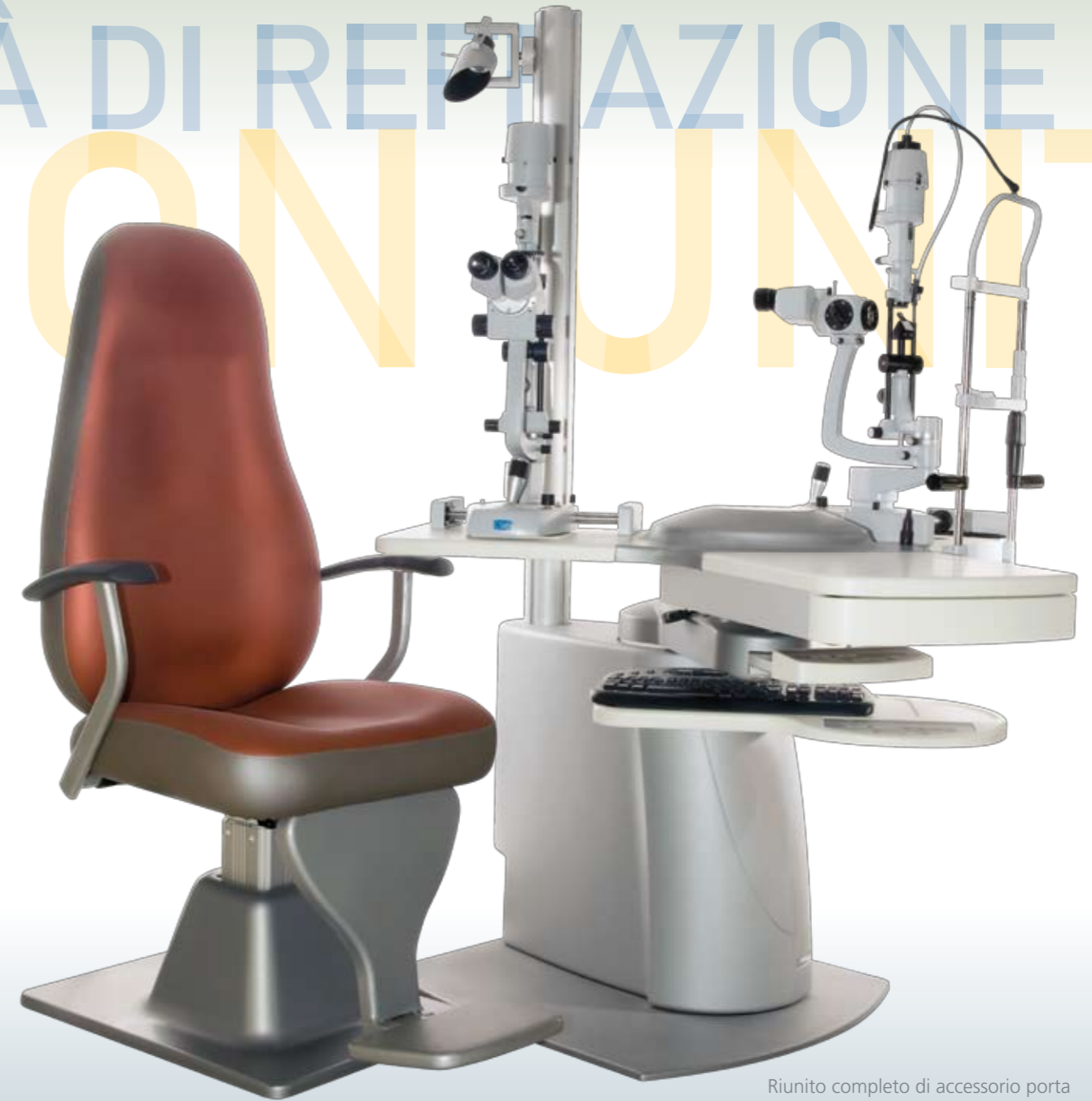
Riunito completo di accessorio porta tastiera computer