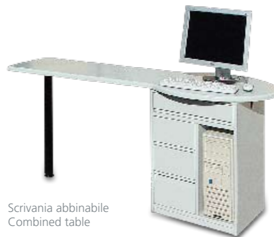
Scrivania abbinabile Combined table

Some accessories are available to adapt the column to the own real needs. An LCD mounting arm, that is perfectly combinable with the column, allows to adjust the monitor positions.